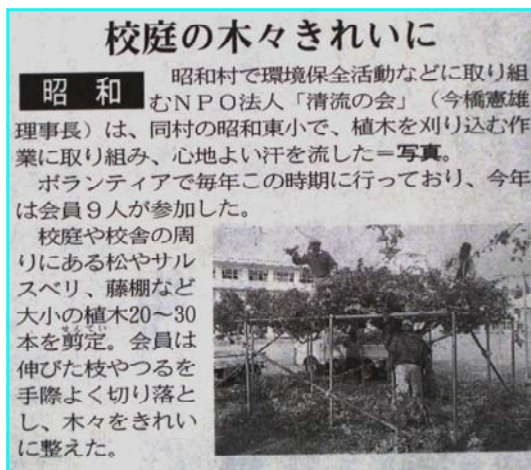
11月10日の上毛新聞から

◇11月14日の5校時に、昭和第1地区環境保全推進協議会の一環として「ごみなし集会」を実施しました。全校児童と全教職員とが一丸となり、学年ごとに地区割りをして、村道を歩きながらごみを拾いました。集積された多量のごみを目の当たりにし、自分たちが住む地区を少しでもきれいに保っていきたいという思いが更に強くなったことでしょう。なお、本校PTAでは10月22日(土)に同様の事業「PTA環境維持保全活動」を実施しています。