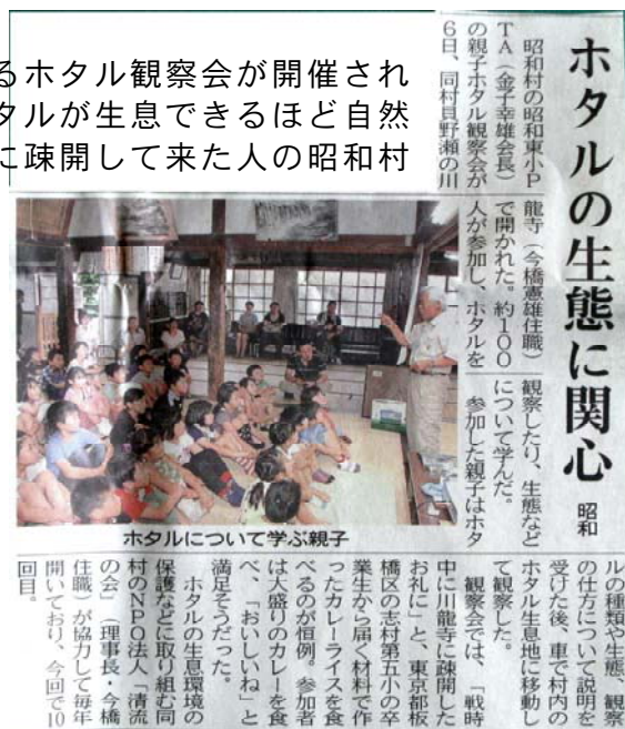
7月8日の上毛新聞から

◇7月6日(土)に「清流の会」とPTAによるホタル観察会が開催されました。このホタル観察会は、昭和村の地がホタルが生息できるほど自然豊かであることを感じてほしい、戦時中昭和村に疎開して来た人の昭和村に対する感謝の心を知ってほしい、との思いから毎年開催され、今年で10年目になります。昭和20年に板橋区志村第五国民学校から川龍寺へ疎開されてきた方が、お世話になったお礼にと毎年カレーを届けてくださっています。そのカレーを使ってPTAの役員さんがビーフカレーを作ってくださいます。また、ホタル生息地は「清流の会」の皆さんが、昭和村の自然の様子を後生に伝えたいとの思いから歳月をかけて手がけてきて、餌となるカワニナが生息できるまでに整備されています。当日はちょうど梅雨明けとなり、絶好のホタル観察日和となりました。100名近い親子が参加しましたが、至る所で歓声が上がっていました。児童が、昭和村を愛する村内外の方々の思いをしっかり受け止めてほしいと願います。