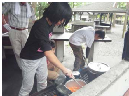
カレーおいしくできるかな？

◇7月23日～24日に5年生の林間学校を実施しました。かまどで火をおこし、飯ごうでご飯を炊き、大きな鍋でカレーを煮ました。文化的な道具を一切使わず、協力して作ったカレーライスには、どの児童も満足の表情を浮かべていました。また、翌朝の清掃では、次に利用する人たちのために隅々まで綺麗にしました。閉校式では施設の方からお褒めの言葉をいただきました。