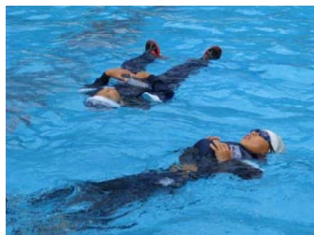
ペットボトルが命の綱になる

◇8月30日に、水泳授業の最後として着衣泳を実施しました。今年は運動会が例年より2週間遅くなりましたので、水泳授業を8月末まで実施しました。着衣泳は水の怖さを知ってほしい、万が一、水難事故に遭遇した際に自らの命を自ら守れる術を身に付けるためです。「重い、特に靴が重い」と、いつもは泳げるのに服を着ていると思うように身体を動かさない、水の怖さを実感したようです。そして、たった一つのペットボトルが浮き輪代わりになることを体験しました。